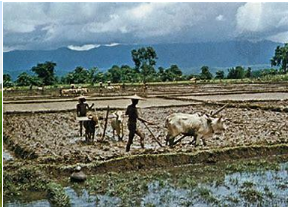
Ploegen in het gebied van het Alaotra meer