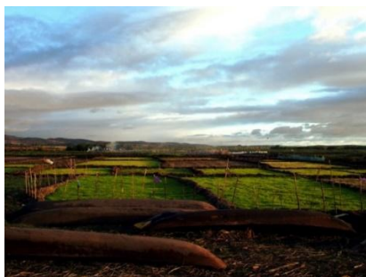
Landschap in het gebied van het Alaotra meer

Algemene kenmerken van bestaande polders in Madagaskar zijn weergegeven in Tabel I.