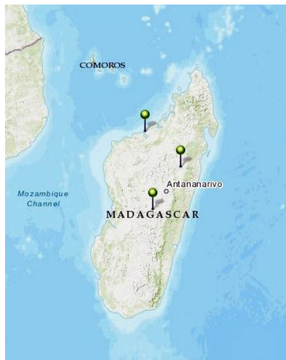
Figuur 3. De ligging van de polders in Madagaskar

De ligging van de polders in Madagaskar is weergegeven in Figuur 3.