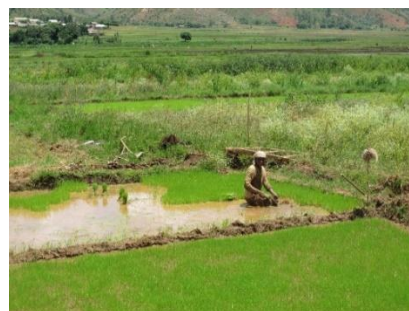
Rijsteelt in het gebied van het Alaotra-meer