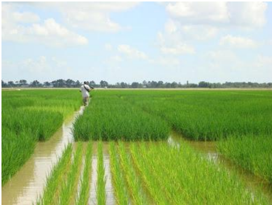
Rijsteelt in het gebied van het Alaotra meer