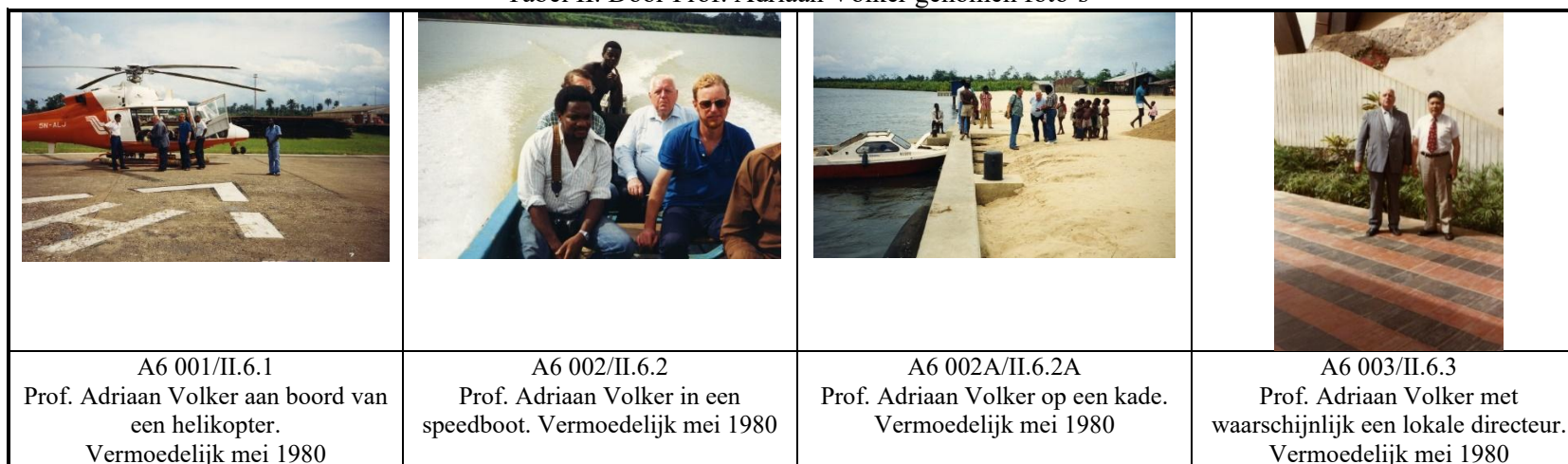
Tabel II.

*) RLL = ingepolderd laagland; LGS = bedijking; DL = droogmakerij