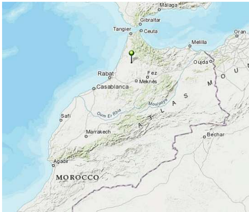
Figuur 3. Ligging van de polders in Marokko

Group Polder Development, Department of Civil Engineering, Delft University of Technology, 1982. Polders of the World. Compendium of polder projects. Delft, the Netherlands United Nations, Department of Economic and Social Affairs, Population Division. 2022. World population prospects, medium prognosis. The 2022 revision. New York, USA.