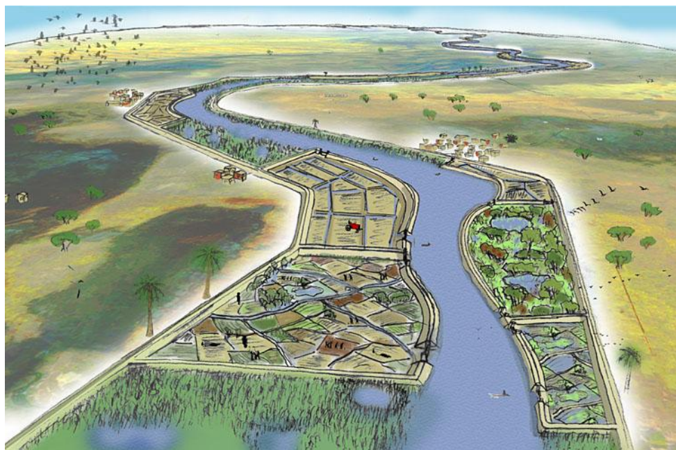
Figuur 2. Artist impressie van de voorgestelde polders in de delta van de Senegal rivier