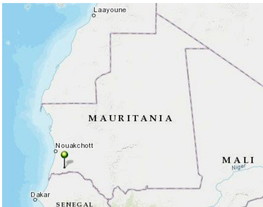
Figure 3. Ligging van de polders in Mauritanië