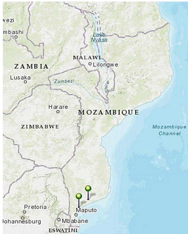
Figuur 1. Ligging van de polders in Mozambique

De door Prof. Adriaan Volker gemaakte foto's worden getoond in Tabel II.