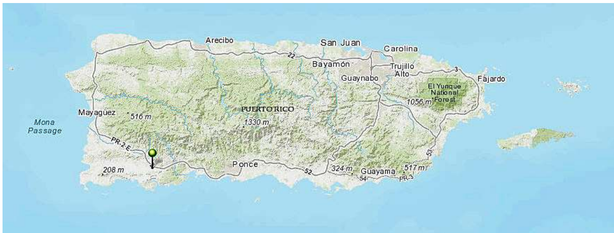
Figuur 1. Locatie van de polders in Puerto Rico

De locatie van de polders in Puerto Rico is weergegeven in Figuur 1.