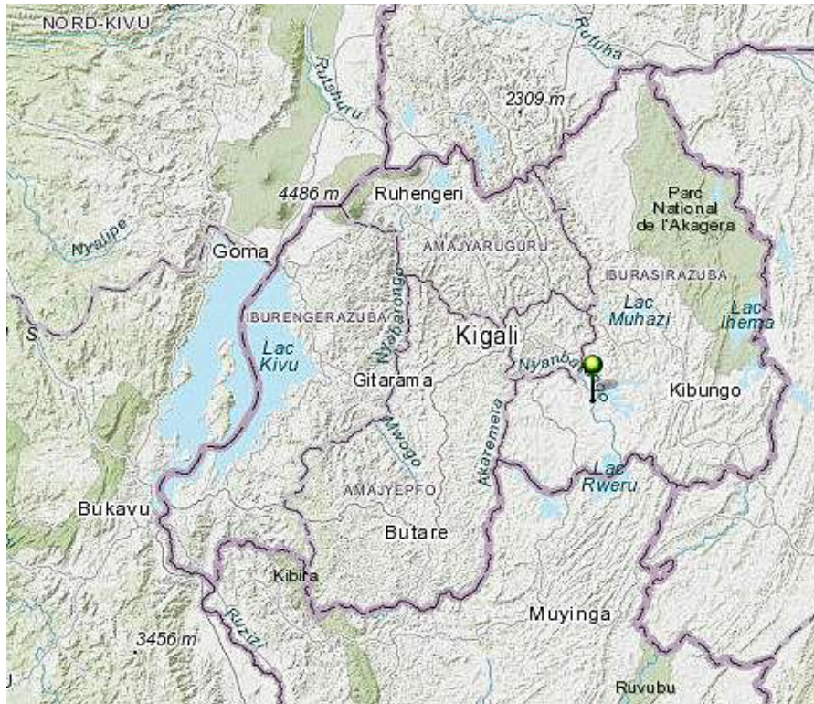
Figuur 1. Ligging van de polders in Rwanda