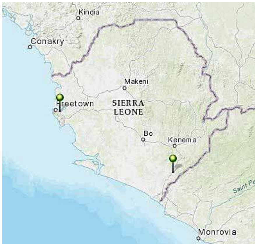
Figuur 7. Locatie van de polders in Sierra Leone

De ligging van de polders in Sierra Leone is weergegeven in Figuur 3.