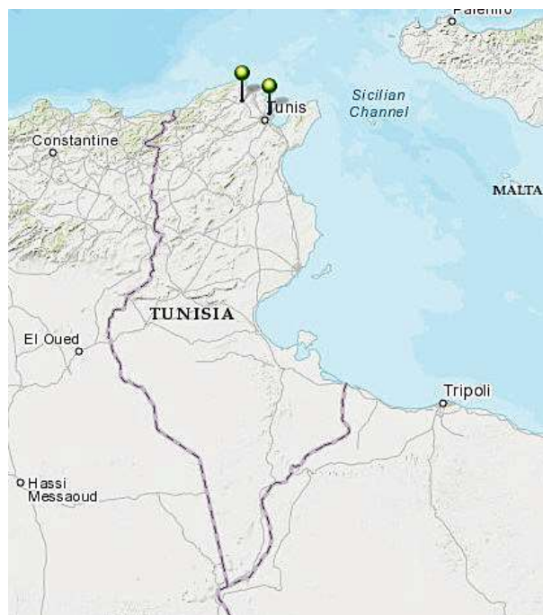
Figuur 3. Ligging van de polders in Tunesië

De ligging van de polders in Tunesië is weergegeven in Figuur 3.