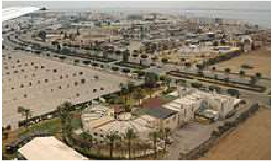
Figuur 2. Luchtfoto van Berges du Lac (bron: Wikipedia)

Berges du Lac . Dit is een welvarende wijk in Tunis. Het heeft zich sinds de jaren tachtig ontwikkeld na de aanleg van polders in het meer van Tunis. Het herbergt veel ambassades en hotels (Figuur 2) (bron: Wikipedia).